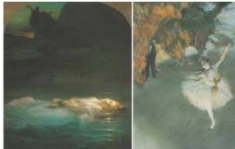
Paul Delaroche à gauche, La Jeune Martyre , de 1855. Edgar Degas à droite, L'Étoile .

Busby Berkeley : chorégraphe de génie des comédies musicales des années 30.