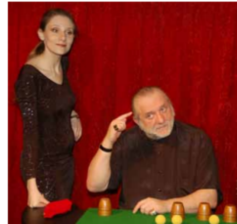
Routine des gobelets de mon père, première routine que nous avons faite en duo.

Après, il y a 1998, la tournée européenne qu'on a faite, papa et moi. Beaucoup de voyages en train, ce qui est super pratique puisque tu peux faire autre chose et le « autre chose » c'est qu'il me dit : « Ce qui serait top c'est que maintenant on fasse un tour ensemble. Il y a un tour qui te ferait kiffer ? » Je lui réponds : « Bah oui ! Les gobelets ! » On a travaillé cela, et de fil en aiguille on a sectorisé la routine pour qu'il y ait ses mouvements et les miens. On a refondu le tour pour que ça devienne un duo.